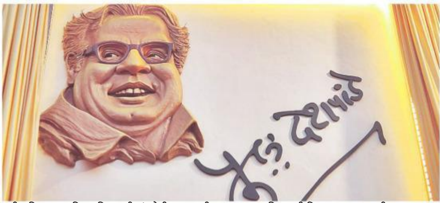
राष्ट्रीय चित्रपट आणि दूरचित्रवाणी संस्थेतील (एफटीआयआय) दूरचित्रवाणी विभागाच्या इमारतीवर साकारण्यात आलेल्या पु. ल. देशपांडे यांच्या भित्तिचित्राचे अनावरण लष्करप्रमुख मनोज नरवणे यांच्या हस्ते शुक्रवारी करण्यात आले.

लष्करप्रमुखांकडून चित्रपट माध्यमाचा गौरव; दूरचित्रवाणी विभागाच्या इमारतीला पु. ल. देशपांडे यांचे नाव